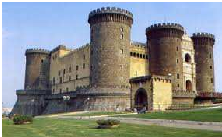
Napoli – Maschio Angioino.