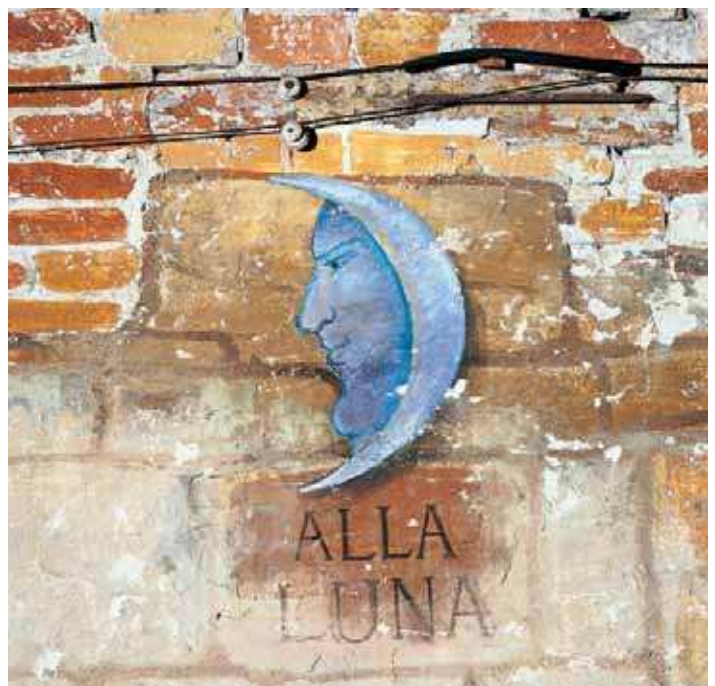
Collegio Femminile della Sapienza Vecchia - Antiche sale ricreative: decorazioni a tempera realizzate dai convittori nel XIX sec.